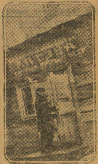
Антэна ў саўгасе імя дзесяцігоддзя БССР, Любаньскага раёна.

Усё гэта ярка сведчыць аб тым, што ў гэтых раёнах няма сапраўд-най барацьбы за развіццё жывё-лагадоўлі. Класавы-варожыя эле-менты, наірыстаючы аслабленнем большэвіцкай пільнасці, працяга-юць на фермах і беспакарава пра-водзяць сваю шкодную работу.