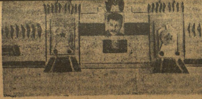
Напярэдні і мал ў Менску. Праект афармлення вонкава з боку плошчы.