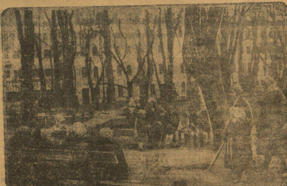
Вяно ў Менску. На сямёры ў сонечны дзень.

МАГІЛЕЎ, 15 красавіка. (Кар. «Звязды»). 9 красавіка ў «Звяздзе» паведамлялася аб злачынствах спекулянтаў Г. Соркіна і В. Апроўста, якія пралегалі на магілеўскі пункт Заготжывёлы. Народны суд, распрабуўшы справу, прыгаварыў: Соркіна да 10 год і Апроўста да 10 год.