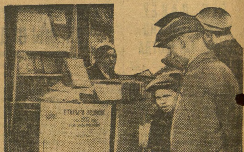
КНИЖНЫ БАЗАР У МЕНСКУ.

Рудзэнская пракуратура ў ходзе следства дапусціла буйную памылку, кваліфікаваўшы класова-варожы выпадак Гаравога і яго кампаніі супроць друку і рэдактара насценнай газеты толькі як хуліганскі ўчынак. Гэта памылка была выпраўлена Рудзэнскім райкомам ВКП(б) і тэрарыстычнаму