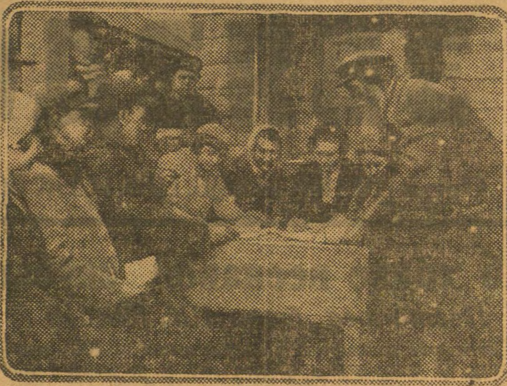
5 мая на базары ў м. Брэгіне была арганізавана масавая праверка і выплата выйгрышаў па пазымах. НА ЗДЫМКУ: кспгаснікі і калгаснікі правяраюць свае аблігацыі.

Совет Народных Камісароў БССР у сувязі з гэтым прапанаваў Дрыбінскаму райвыканкому неадкладна прыняць меры да ліквідацыі агіднасцей і недахопаў, якія наглядзіліся ў калгасе «Звязда». Пракуратра рэспублікі павінна забяспечыць неадкладны разгляд сираў аб раскраданні калгаснай маёмасці ў калгасе. На працягу