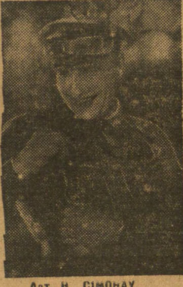
Арт. Н. СІМОНАУ.