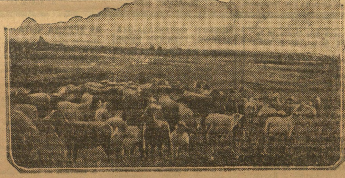
Калгас «Беларуская вёска», Вяляшкоўскага сельсавета (Лізнянскі раён), у 1933 годзе купіў у розных калгасах раёна 27 каштоўнейшых авчак пароды эксфоршырдаўнаў. Была арганізавана племянная аўцагодчая ферма. За два гады з гэтай фермы многія калгасы раёна набылі каштоўнейшых бараноў-вытворнікаў. У сучасны момант на ферме налічваецца 82 авчкі. НА ЗДЫМКУ: эксфоршырдаўны на пашы.

быгады: Жайлакоў Сцяпан, Гузоўскі Іван і Папкоў Самуіл амаль кожны дзень узорвалі па 0,90 гектара, пры норме ў 0,60 гектара. Яны рана, разам з усходам сонца, выязджалі ў поле. Бралі з сабой сена, там у часе перапынку падкармлівалі ковей.