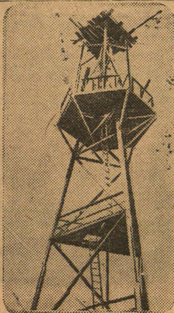
Парашутная вышка на ўсебеларускім стадыёне.

За бездушныя адносіны да работніц партыйны камітэт прыцягвае да адказнасці намесніка дырэктара Ташішова і прафарганізатара ўчаст-