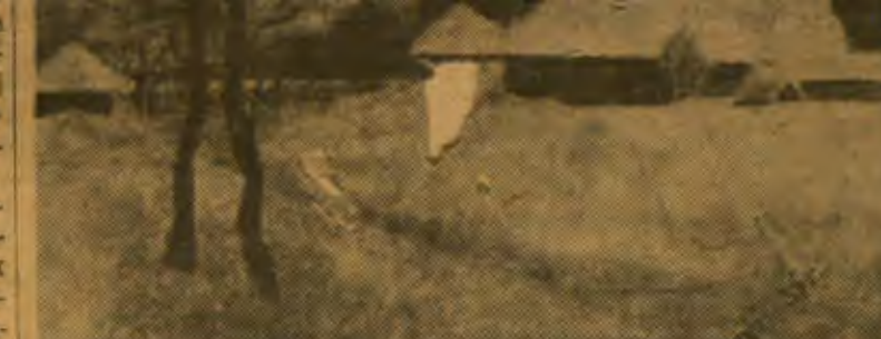
ЗИМА. Рисунок НОДЭЛЬМАНА.

шэе ўзвіжце дзержышы працоўных, барацьба за аўданне вышэйшымі марксізма-ленінізма, лі- таратуры і мастацтва, навукі і тэхнікі патрабуе ад кожнага чле- на партыі і комсомольца актыўна- га ўдзелу ў рабоце бібліятэкі. ЦК рэкамендуе партыйным ар- ганізацыям увесці ў практыку сва- ёй работы паслухоўванне асобных членаў партыі аб тым, як яны чы- таюць грамадска-налітычную і ма- стацкую літаратуру, ступень іх ўдзелу ў рабоце бібліятэкі.