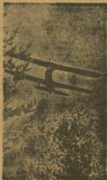
Усеаароднае свята ў Оршы. Семалет Аршенскага аэроплуба на масоўцы.

Трымясячны завод імя Ланцуцкага: ЧУЙКО, ЛІКУТАУ, ХАРУНОУ.