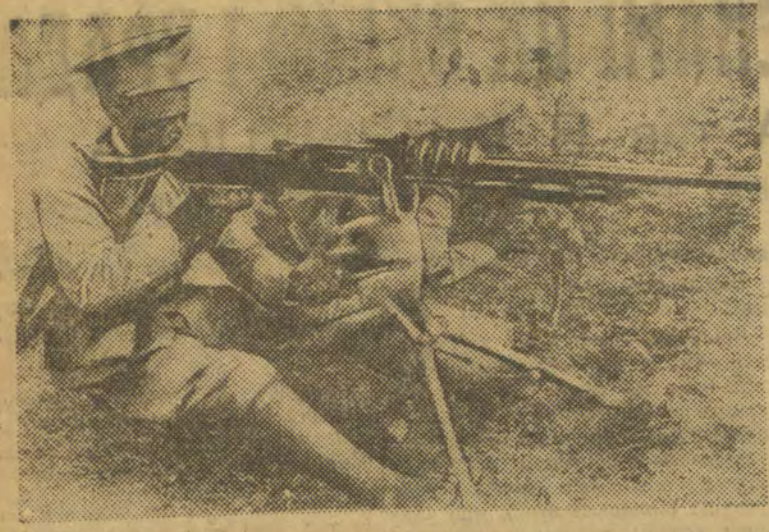
ИТАЛА-АБИСИНСКАЯ ВАЙНА. НА ЗДЫМКУ: абісініскі кулямётчык на занятках з кулямётам.