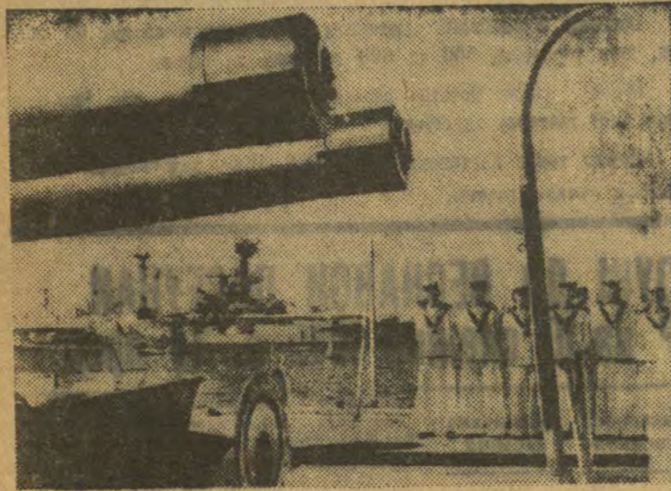
21 лістапада недалёка ад Александрый адбыліся маневры англійскага флота, у якіх прынялі ўдзел: 5 лінійнаў, 6 крэйсераў, 18 знішчальнікаў і 2 авіямаці. НА ЗДЫМКУ: жэрла 30-сантыметровай гарматы англійскага лінійна «Куін Елізабет».