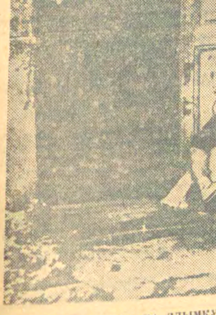
ДА ПІДЗЕВ У ІСПАНІІ. НА ЗДЫМКУ: дзеці, страўнаны свай бацькоў у часе баяў на паўднёвым фронце.

Тут-жа калгаснікі Рагазоў, Сметкоў, Ставанібарны, Капоцін, Раманкевіч і ішчыя ўнеслі па 10 руб. кожны. За адзін вечаў абрана 238 руб. Д. ВІННІКАЎ.