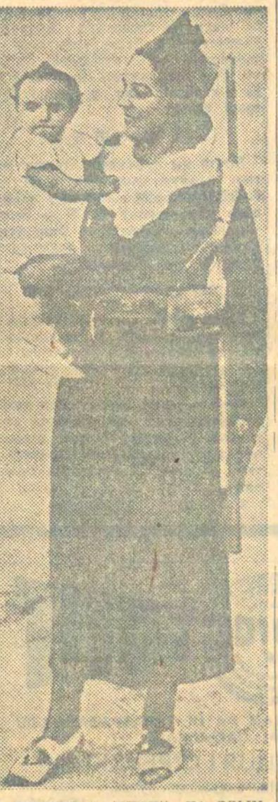
ДА ПІДЗЕВ У ІСПАНІІ. НА ЗДЫМКУ: дзеці, страўнаны свай бацькоў у часе баяў на паўднёвым фронце.

Прафесары: КРЫЧЭЎСкі, ЧЭРНЫШКОВА, КУПРЫЕЎ, КРОЛЬ, КАРПІЛАЎ. Урачы: МАСКОВА, МАТШУК, ГОРШТАЙН, ШЭЙНІН, ГЕРШУН, ШАПІРА, ВЯЗЬМІНСкі, ЯНЕРСОН, БРАХМАН, КЛЕЙН, ЛІУШЫЦ, БАРОУСКАЯ, ЗНЦІН, БЕЛКІН, БЕЗМЕН, ЛУР'Е, МЕРГОЛЬД, ГУРВІЧ, ШЭНДЭ-РОВІЧ.