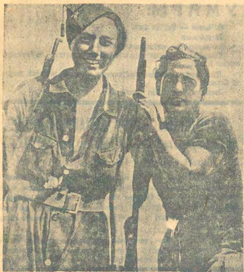
ДА ПАДЗЕЙ У ІСПАНІІ. НА ФІЛЬМКУ: таварыш на рабоце і на досугу, апраць таварыш у бараце супроць фашысцкіх імкненняў на кантралі (ФФ).