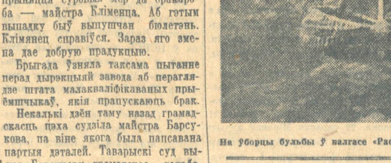
На уборцы бульбы ў жаласе «Рассвет», Замошскага сельсавета, Асіповіцкага раёна.