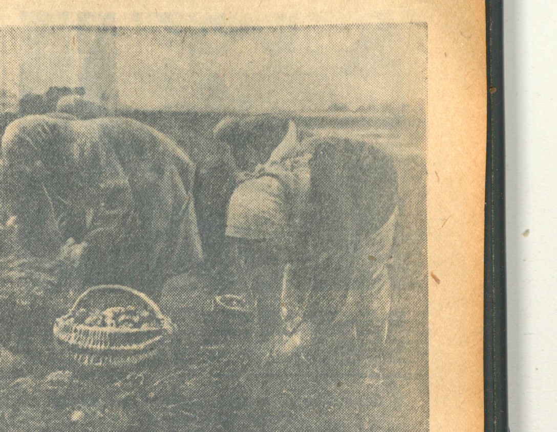
На уборцы бульбы ў жаласе «Рассвет», Замошскага сельсавета, Асіповіцкага раёна.

— Тав. Каваленкі Чарніцкага раёна ў сваім пісьме скардзілася што інструктар дарожнага аддзялення Чарніцкага раёна Котэў няправільна на пазваў на работу рахункавода адначасна ішчарнасіці.