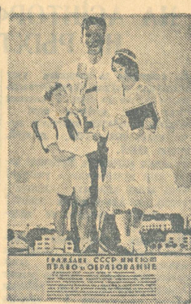
Гэтыя дзеі ў СССР выклікалі ілюзію аб'явы свабоды.