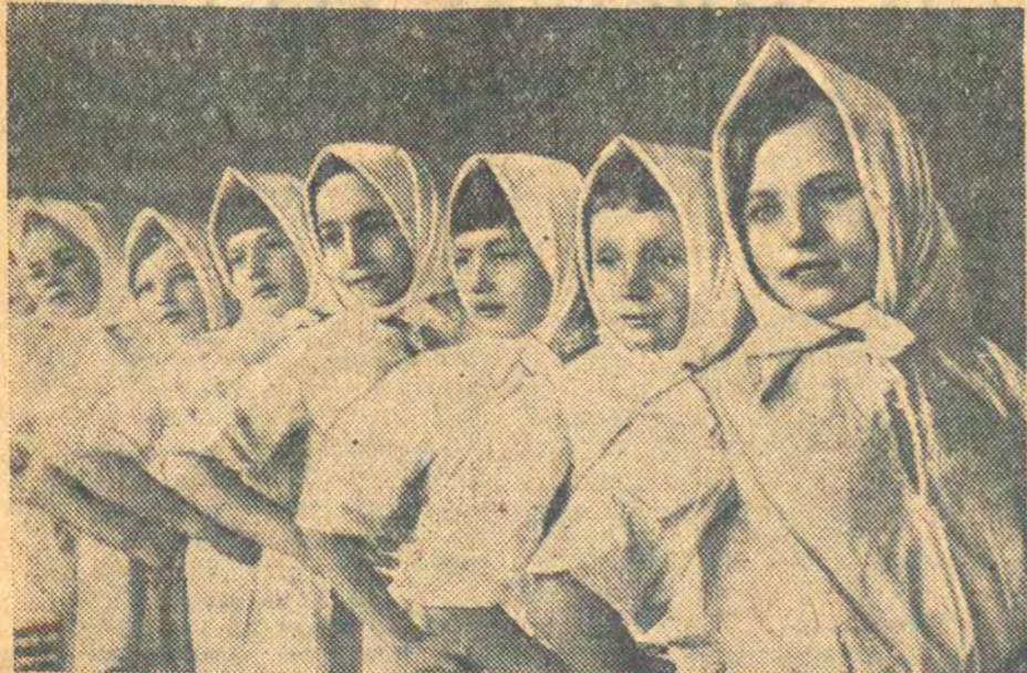
На Усебеларускай алімпіядзе мастацкай самадзейнасці выхаванцаў дзіцячых дамоў. НА ЗДЫМКУ: выхаванцы гомельскага сельскага дома выконваюць танец «Матрышка».