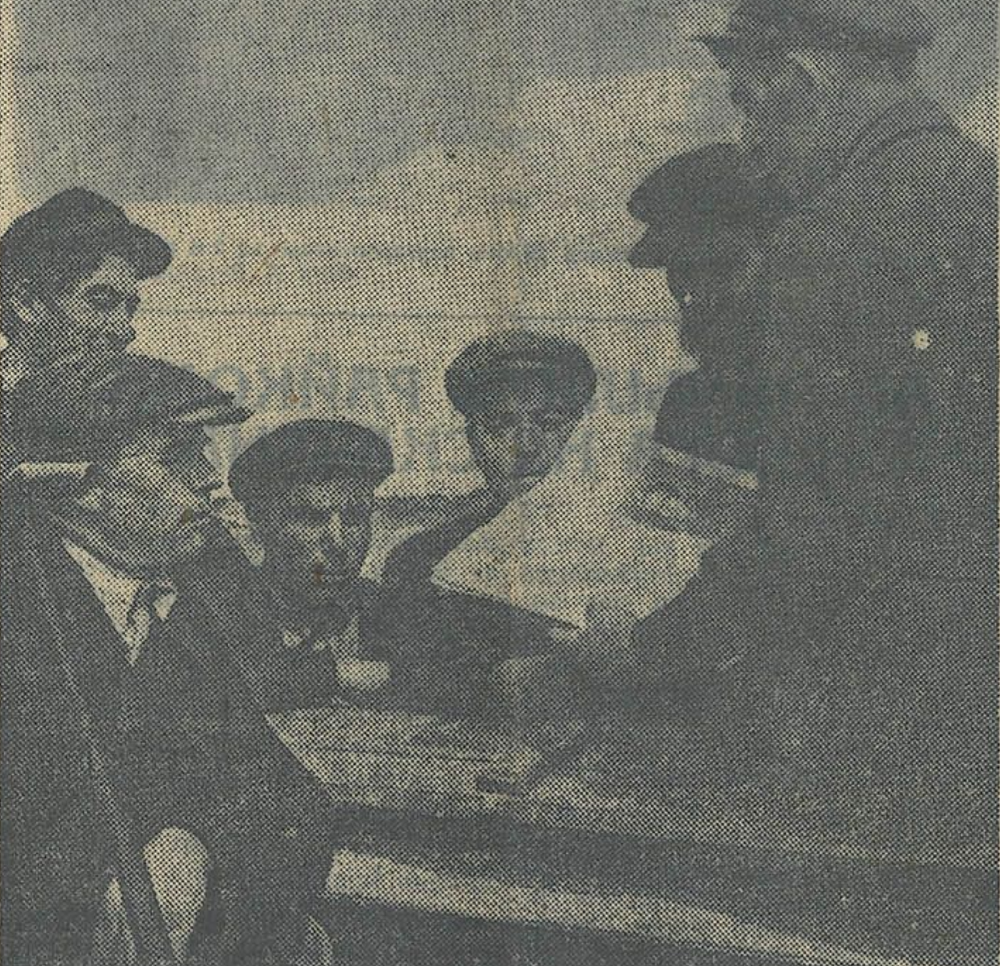
У калгасе «Савічы», Брагінскага раёна, у перадаёй па службе брыгадзе № 3 наладжана рэгулярная чытка газет у абедзены перапынак. НА ЗДЫМКУ: чытка ў брыгадзе газеты «Правда».