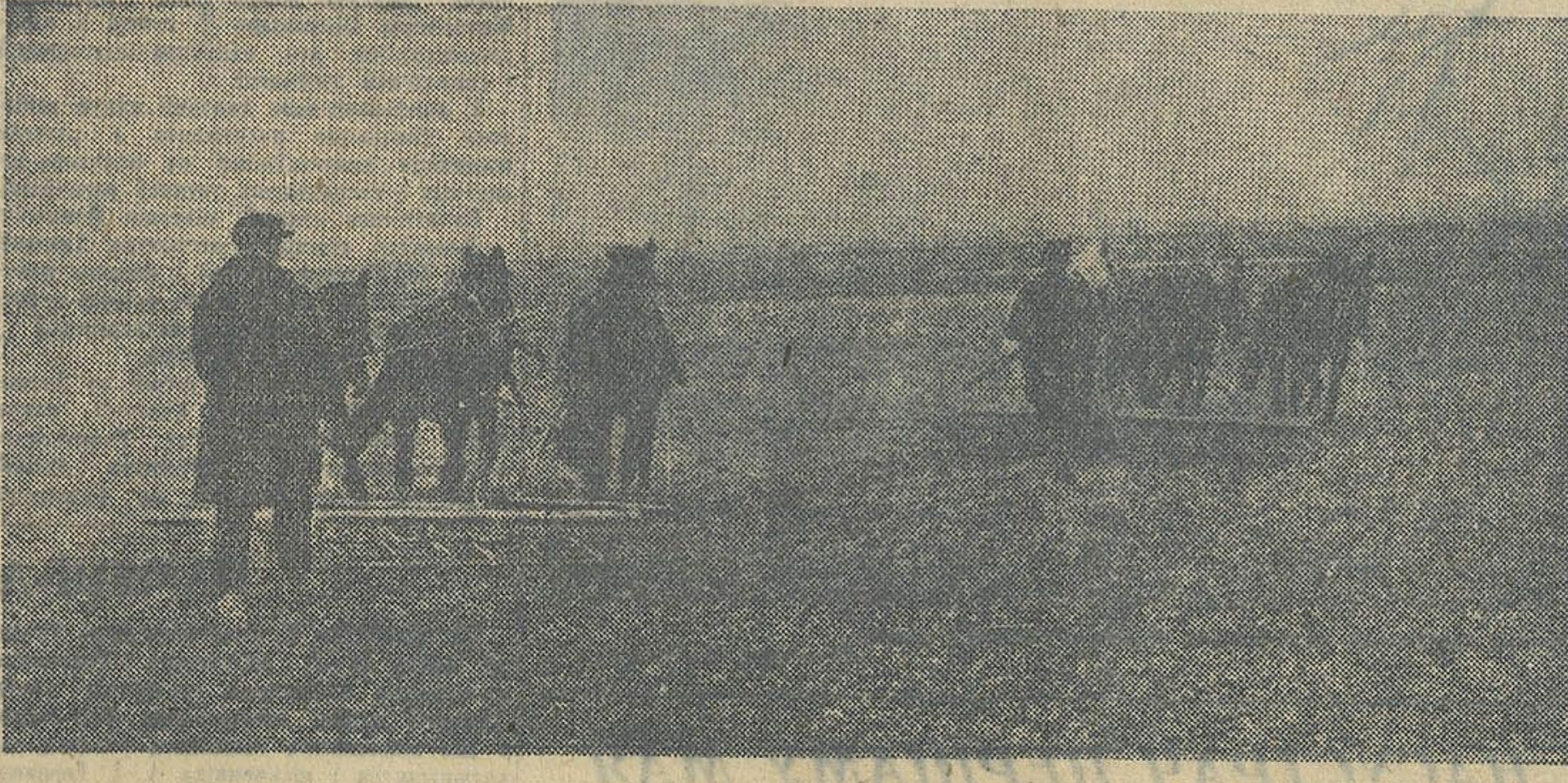
Першая перадавая брыгада калгаса імя Капіліна, Блоньскага сельсавета, Пухавіцкага раёна, на баранававіні.