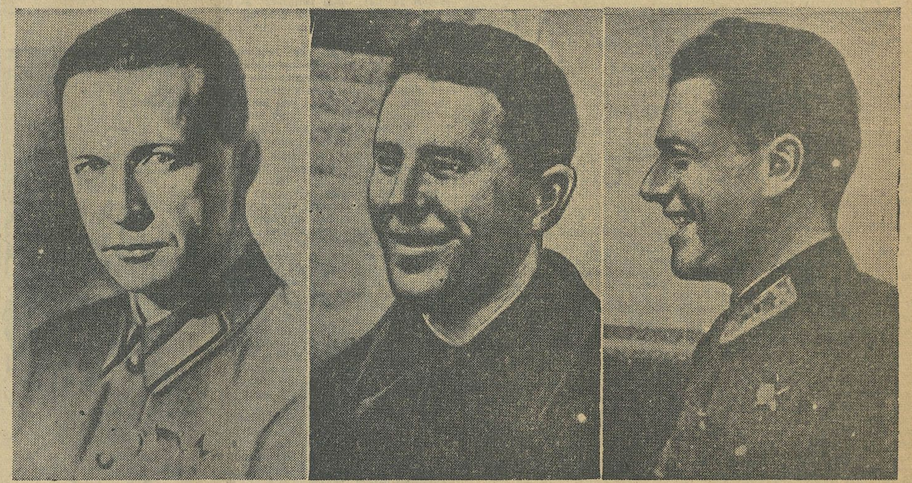
Экіпаж самалёта «АНТ-25», злева направа: камандзір самалёта — Герой Савецкага Саюза М. М. Громаў, штурман — ваенінжынер 3-га ранга С. А. Данілін і другі палётчык — майр А. Б. Юмашоў.

Слаўныя героі, мужныя лётчыкі Громаў, Юмашоў і Данілік: устанавілі новы сусветны рэкорд дальнасці палёту па прамой.