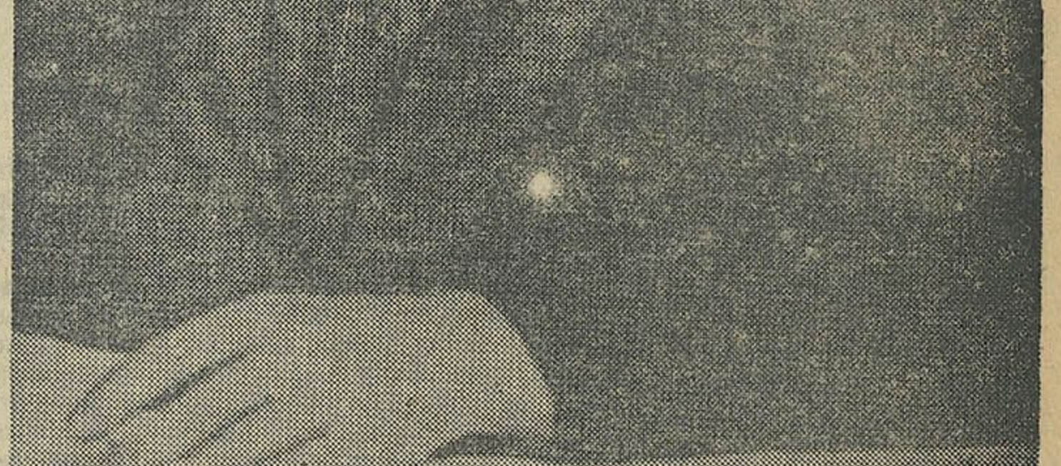
11 год назад спынілася сэрца палкаго большэвіка, вярлага сына партыі Леніна—Сталіна Фелікса Эдмундавіча Дзержынскага.

Прэзідыум Цэнтральнага Выканаўчага Камітэта ЦСРР пастанавіў зацвердзіць тав. Гілінскага Абрама Лазаравіча намеснікам народнага камісара харчовай прамысловасці СССР.