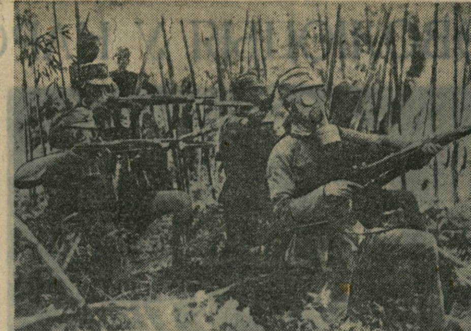
Да ваенных падзей у Кітаі. НА ЗДЫМКУ: кітайскія байцы перад наступленнем.

У выніку гэтай доўгай дыскусіі было рашана, што французскія прапановы будуць накіраваны на разгляд адпаведных урадаў і тав. Каб праз тры дні па іх былі даны адказ. Наступнае пасяджэнне падкамісіі назначана на 19 кастрычніка.