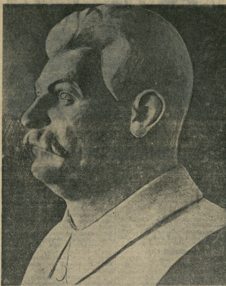
Бюст таварыша Сталіна, выразаны з бярозы шавецкім народным шаўцом Сяміанам Дудковым, Бялініцкага раёна, вёскі Цехцін, для выстаўкі народнай творчасці.

Складу напэсакі МЯТЛІЦКІ Е. 45 г. з калгаса «Комінтэрн», Хойніцкі раён, 1937 г.