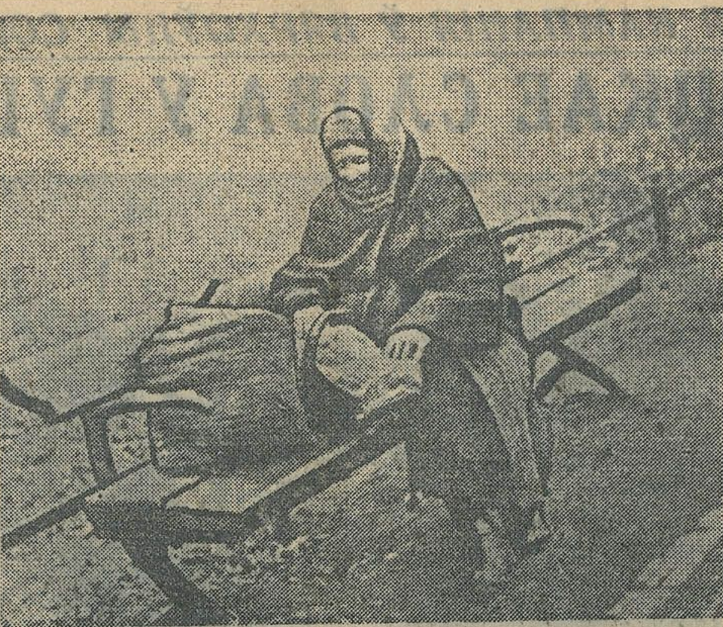
Мрачнае і бязрадаснае жыццё народных мас у краінах фашызма. Гаспадаранне германскіх фашыстаў асуджае шырокія народныя масы на голодне, беспраўнае і безправаснае жыццё. Кваліфікаваныя рабочыя, інжынеры, таленавітыя майстры мастратца марна прабуюць знайсці прымяненне сваім здольнасцям. Яны асуджаны на маршавы і неадданы, яны пазбавлены жыцця, пазбавлены ўсіх радасцей жыцця. НА ЗДЫМКУ: у фашысцкай Германіі. Гэта жанчына была нямецкай актрысай!

ЛОДАН. 18 кастрычніка. (БЕЛТА). Кансерватывная газета «Дэйлі тэлеграф» паведамляе, што ў Адыс-Абеба вызваў аб'явіць паўстанне абісінаў. Жалючы стварыць вольную армію з тубылнаў, італьянцы прыступілі да забіцця італьянскіх тысяч абісінаў. Абісінскія ракурсы, атрымалішы зброю, паяліся на загалі вызначачаму сігналу паўстанне і забіць сваіх камандзіраў — італьянскіх афіцэраў. Усе каланіяльныя войскі, якія яшчэ ў распарэжэнні італьянцаў, былі быстра перакінуты ў Адыс-Абебу, і паўстанне было паўдушана.