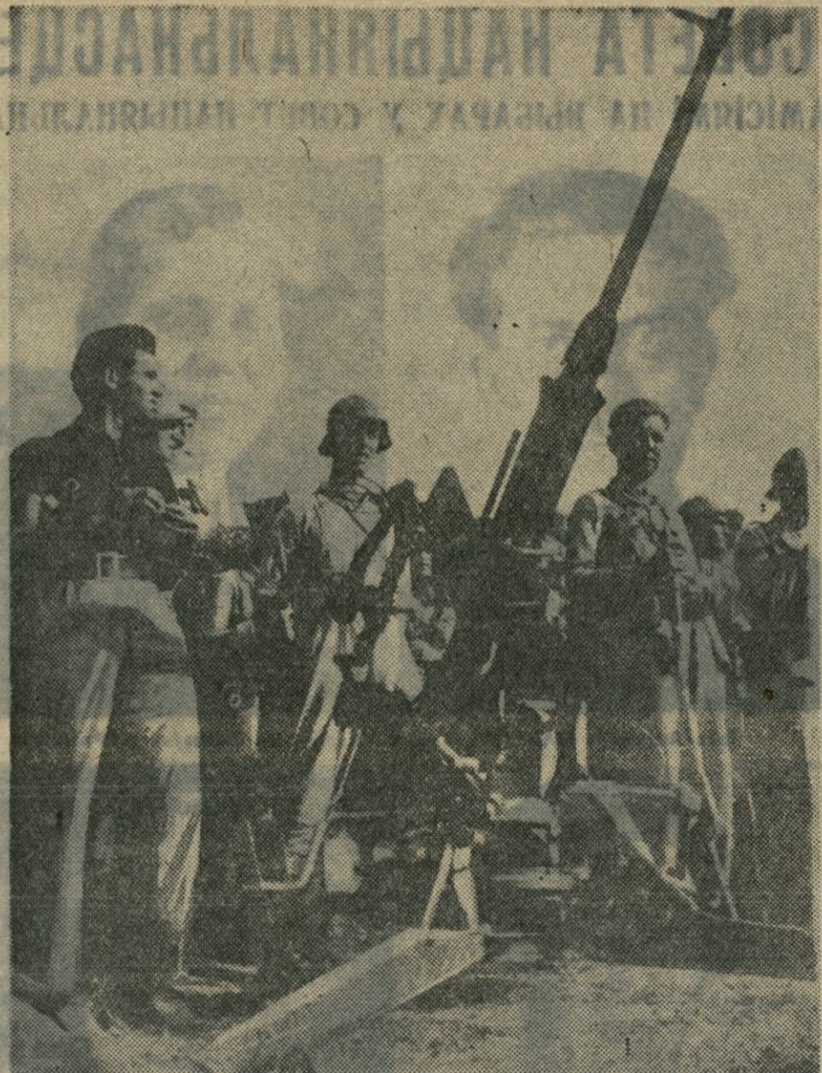
Да гадзінны абароны Мадрыда. НА ЗДЫМКУ: рэспубліканскія байцы абстрэльваюць фашысцкую авіяцыю.