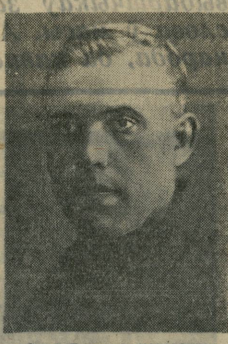
Сяргей Парфенавіч МАКАРЭНКА