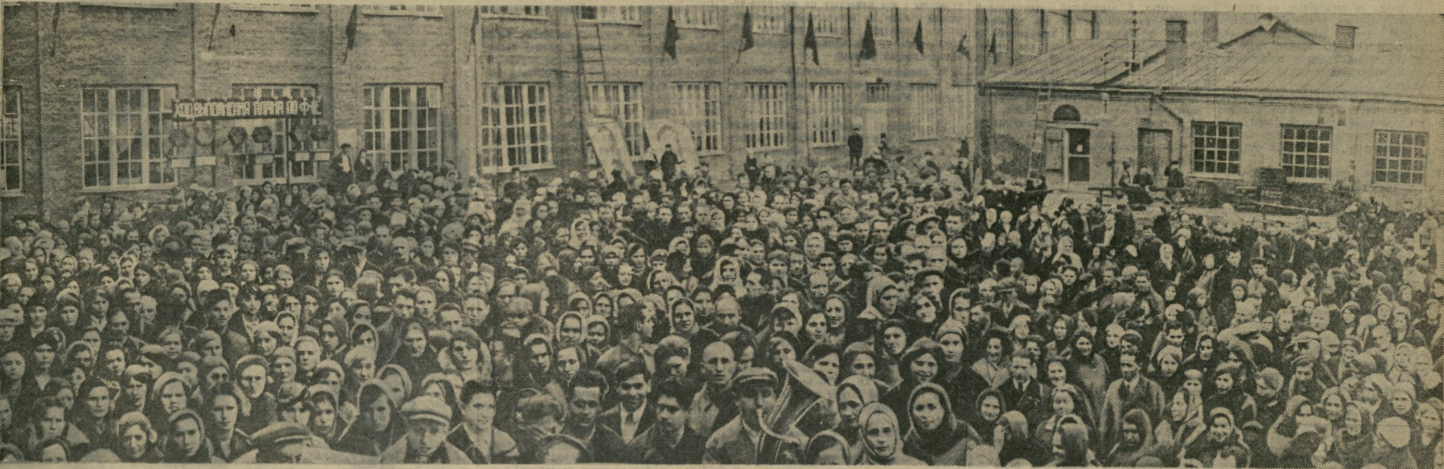
Рабочыя менскай швейнай фабрыкі «Кастрычнік» з вялікім захапленнем сустрэлі паведамленне аб згодзе маршала Савецкага Саюза таварыша Ц. Е. Варашылава балатыравацца ў дэпутаты Савета Саюза па Менскай гарадской выбарчай акрузе. НА ЗДЫМКУ: мітынг выбаршчыкаў фабрыкі «Кастрычнік».

Выбарчая кампанія ўступае ў рашаючы этап. Разгортванне арганізацыйнай і агітацыйна-прапагандыскай работы на выбарчым участку, шырокая агітацыя сярод усіх выбаршчыкаў за зарэгістраваных кандыдатаў у дэпутаты Вярхоўнага Савета—важнейшая задача партыйных і савецкіх арганізацый.