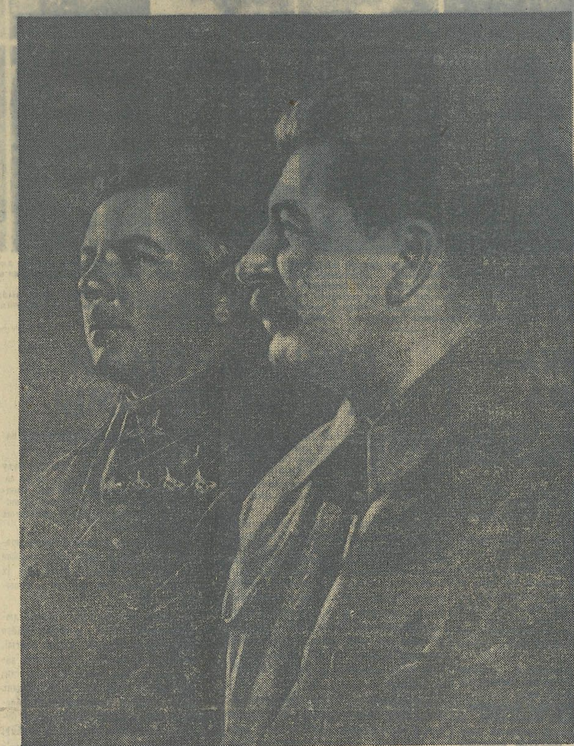
Іосіф Вісар'янавіч СТАЛІН — першы дэпутат Вярхоўнага Савета СССР ад Сталінскай выбарчай акругі горада Масквы і Клімент Эфрэмавіч ВАРШАЙЛАЎ — дэпутат Вярхоўнага Савета СССР ад Менскай гарадской выбарчай акругі.

Вярхоўны Совет СССР выбран! Нахай жыве Вярхоўны Совет!