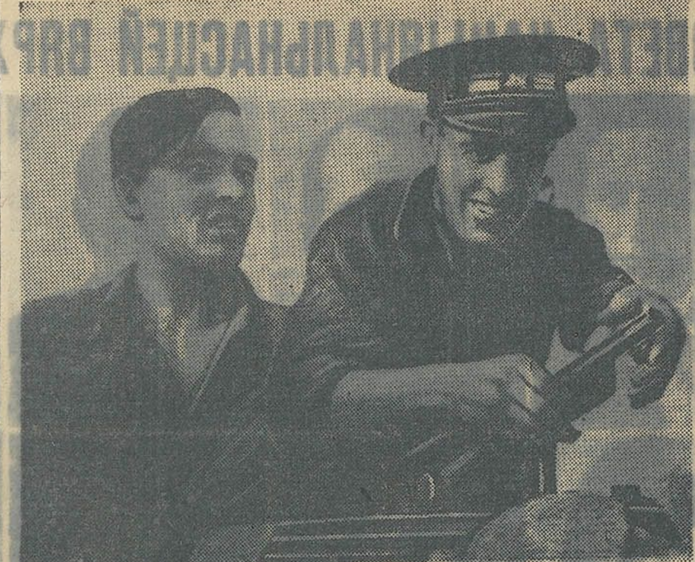
На фронтах у Іспаніі. У раёне Сарагосы распуліцанскія войскі скарыстоўваюць для абстрау паліцэйскіх непрыяцельскіх маршчы. НА ЗДЫМКУ: зарэдка акало маршчы.