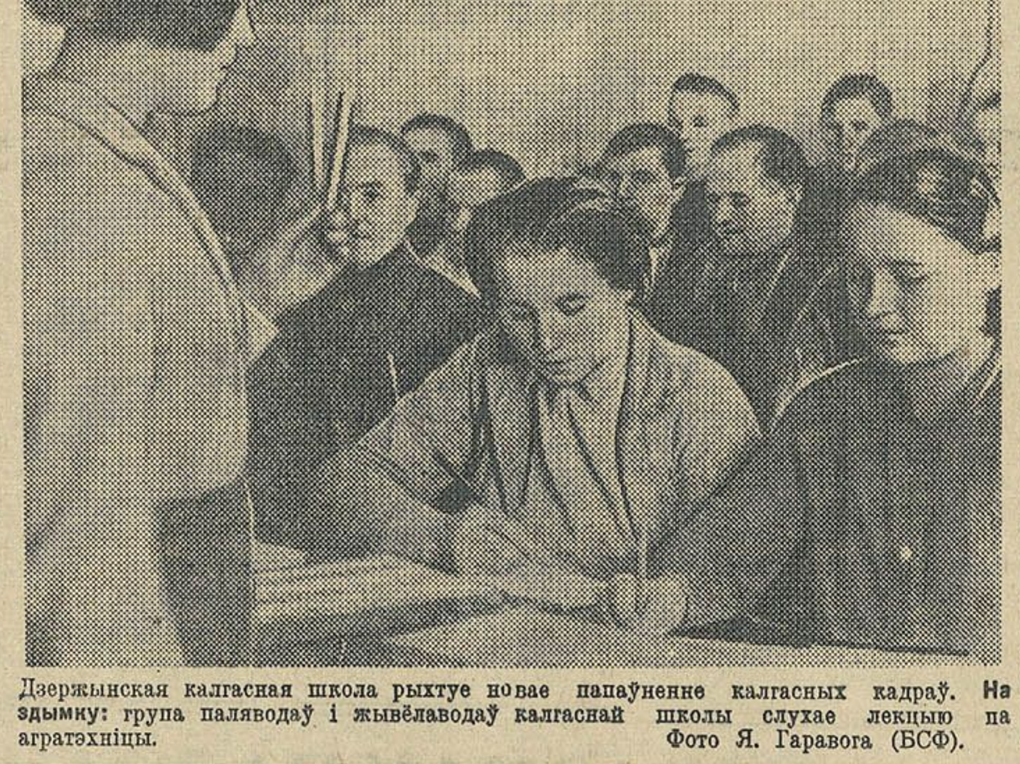
Дзержынская калгасная школа рыхтуе новае палупеенне калгасных кадраў. На здымку: група палаводоў і жывёлаводаў калгаснай школы слухае лекцыю па агратэхніцы.