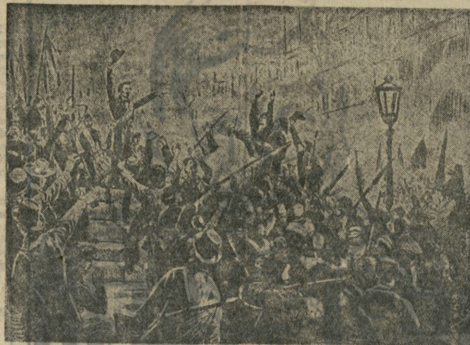
Агапаніа Парыжскай Комуны