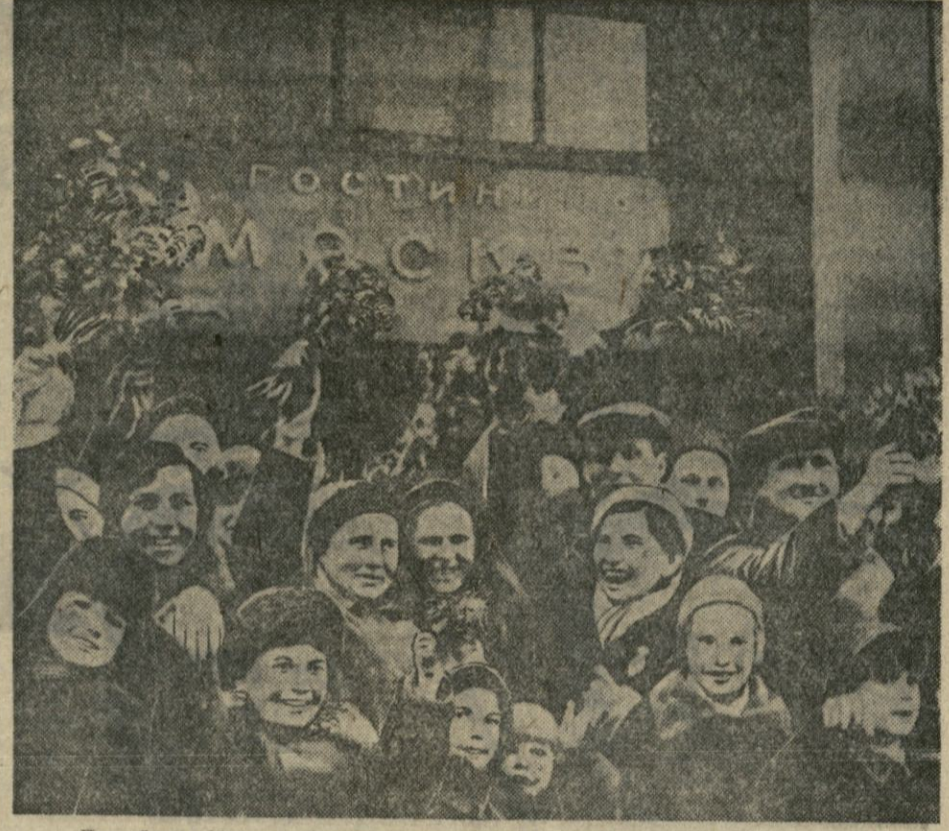
Працоўная Масква вітае праздзяючых герояў-папанінаў (Охотны рад).

Давольце мітынг працоўных горада Масквы, прысвечаны аўтару гераічнай чацвёркі папанінаў на Вялікую зямлю, абвясціць адкрытым. (Апладысменты, «Інтэрнацыянал»).