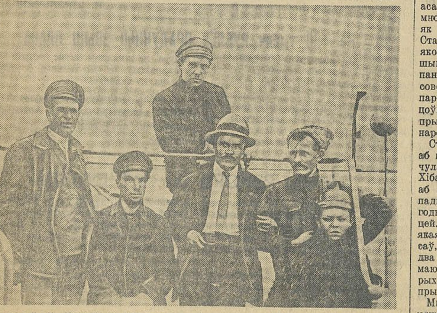
Таварыш В. М. Молатаў на агітаварондзе «Красная асада» у перыяд грамадзянскай вайны (1919 год).