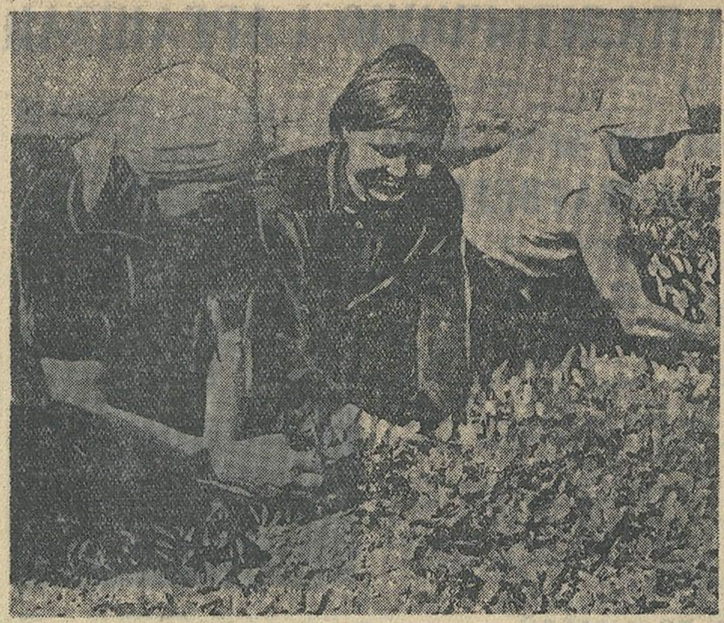
У калгасе імя Чырвонай Арміі, Благіскага сельсовета, Віцебскага раёна, дзесяці гектараў лепшай зямлі аддзелена пад аграрныя культуры. Ураджай гародніны ў калгасе імя Чырвонай Арміі.

ТОКІО, 20 червня. (БЕЛТА). 17 червня павераны ў справах СССР Сметанін наведваў віцэ-міністра замежных спраў Харынаўці і зрабіў яму прадстаўленне з паводу бамбардыроўкі безабароннага мірнага населення і неабароненых мірных гарадоў Кітая з боку японскай арміі, асабліва з боку авіяцыі. У сваёй заяве Сметанін асоба адзначыў бамбардыроўку Кантона, якая прадаўжаецца на працягу некалькіх тыдняў і ўжо выклікала шмат тысяч афяр, у тым ліку волядарную колькасць жанчын і дзяцей. У заяве ўказваецца на тое, што дзеянні японскай авіяцыі ў Кантоне з'яўляюцца зусім неапраўданым актам жорсткага гвалту над мірным безабаронным населеннем, і што яны выклікалі пацучце найглыбейшага абурэння ў грамадскай думцы павлізаных краін свету, і ў тым ліку Савецкага Саюза. Адлюстраваны пацучці савецкага народа, урад СССР выразіў сваё настойлівае жаданне, каб падобныя налеты супроць безабароннага населення і мірных гарадоў Кітая былі спынены.