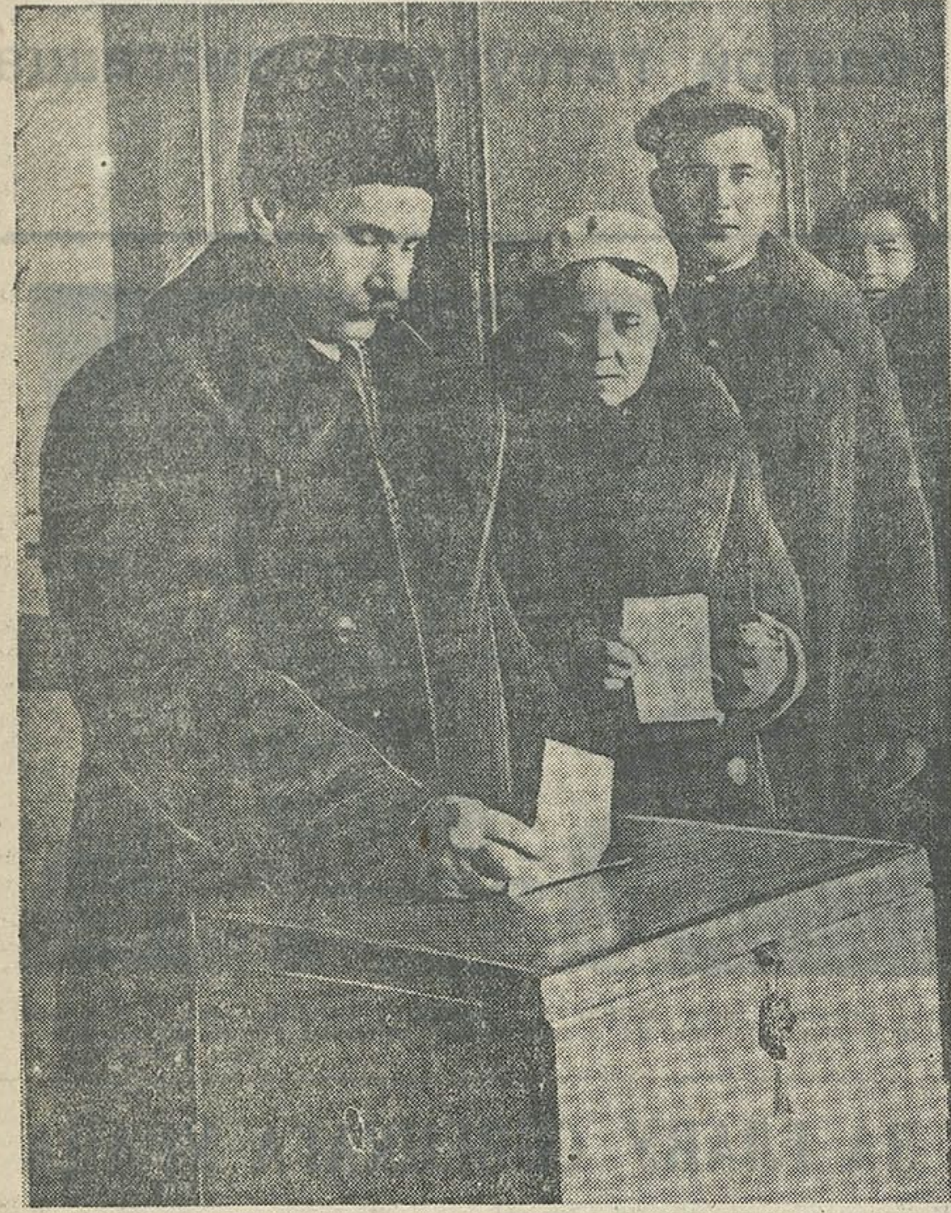
Народны паэт Беларусі Якуб Колас з жонкай Марыяй Дамітрыеўнай на выбарчай урне.