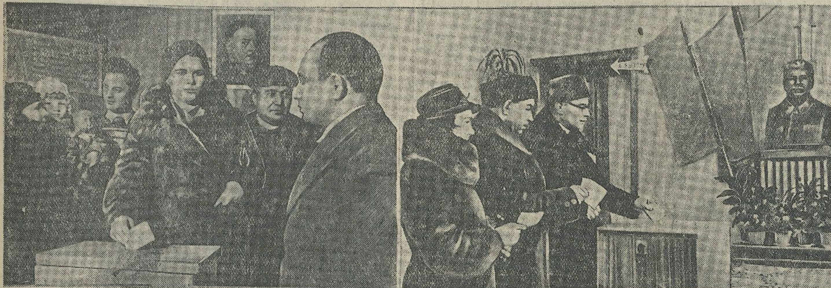
НА ВДЫМКАХ (злева направа): у 20-й акрузе 6 выбарчага ўчастка. Момент галасавання за кандыдатаў дэпутатаў Мінскага гарадскога Савета дэпутатаў працоўных — прадвайдра, друга і настаўніка сусветнага пролетарыята за кандыдатаў дэпутатаў Мінскага гарадскога Савета дэпутатаў працоўных — главу Саветаў Урада Вячаслава Міхайлавіча Молатава.

Выбары з'явіліся магутнай дэманстрацыяй любові і адданасці народа партыі Леніна—Сталіна, баявой гатоўнасці змагацца за новыя перамогі камунізму.