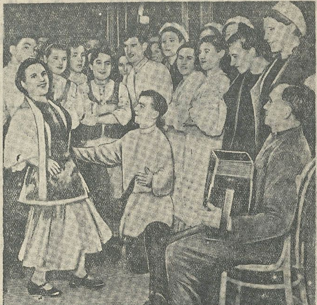
Выступленне гуртка самадзейнасці прасвай фабрыкі «Кастрычнік» перад выбаршчыкамі ў гэтым участку.

Перад ад'ездам мы зайшлі ў залу чакаання. У адной палатцы памяшкання калгаснікі чакалі, да іх паслуг быў багаты buffet, а ў другой палатцы памяшкання іграў гармонік і ў таіт яму радасна калгасная моладзь танцавала беларускія народныя танцы.