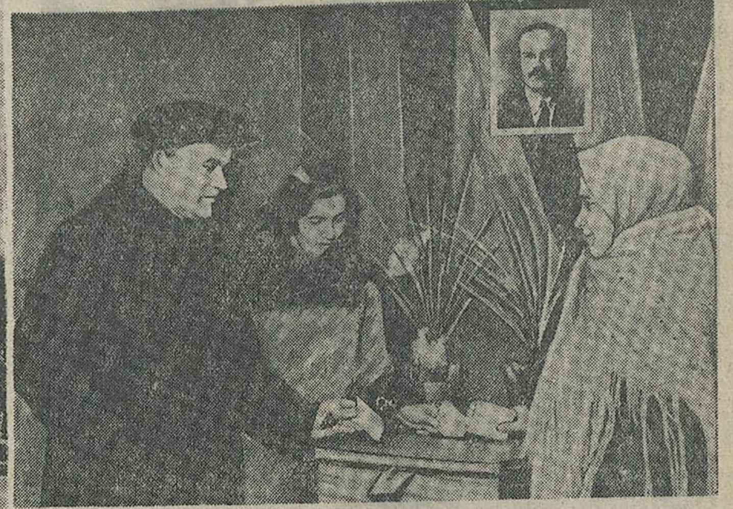
Маршала Саветаў Саюза Клімента Ефрэмавіча Варашылава. У 172-й акрузе Іосіфа Вісарыянавіча Сталіна. У 300-й акрузе 5 выбарчага ўчастка. Момент галасавання за кандыдатаў дэпутатаў Мінскага гарадскога Савета дэпутатаў працоўных — главу Саветаў Урада Вячаслава Міхайлавіча Молатава.