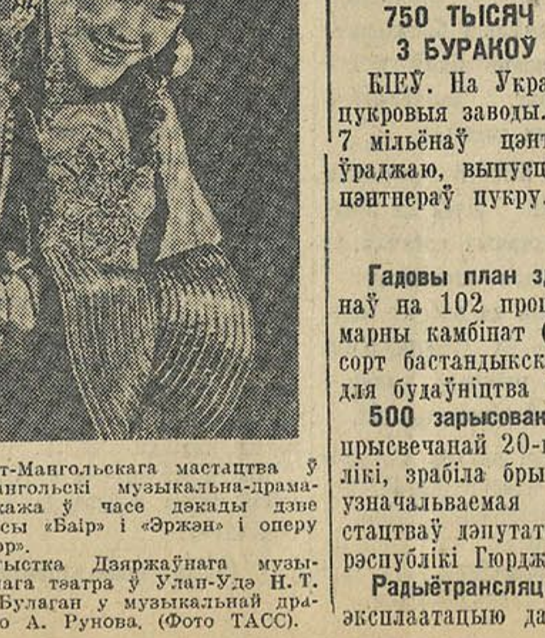
Да дэкады Бурат-Монгольскага мастацтва ў Маскве. Бурат-Монгольскі музыкальна-драма-тычны тэатр паказаў ў часе дэкады дра-мамузыкальныя прэсы «Байр» і «Эржэн» і оперу «Бэе Вулад Батор».

ДА СТАГОДДЗЯ З ДНЯ НАРАДЖЭННЯ Д. І. ПІСАРЭВА. ЛЕНІНГРАД. Калектыву Ленінградскага ўніверсітэта шырока адзначае 100-годдзе з дня нараджэння вядомага рускага кры-тыка і публіцыста Д. І. Писарова.