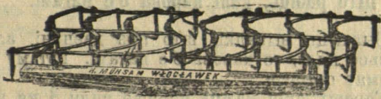
Барана тыпу Гаварда.

Добра зробленая барана павінна мець зубы падобныя на шырокі нож, альбо нават квадратовыя, якія мусяць быць зроблены з самага лепшага, ня ломкага, мягкага жалеза, а яшчэ лепш з мягкай сталі. Самая рама бараны павінна быць найлепш з карытавыгляднага або вуглавога ці квадратавога жалеза, альбо ў крайнасці з моцнага дзерава. Пры гэтым зубы ў дзеравяннай раме павінны быць пастаўлены на востры кант уперад, а самае востры зубоў адкована так, каб можна было працаваць бараной уперад і назад і каб пры працы ўперад зуб браў глыбей, а пры працы назад — мялчэй. Сьляды ад зубоў ніколі не павінны ісьці адзін за адным, а кожны зуб — мець свой сьлед на роўнай адлегласьці адзін ад аднаго. У добра збудаванае бараны бывае ня больш, як 20 або 24 сьляды зубоў на грацягу аднаго мэтра.