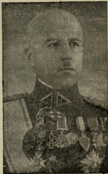
Hien. St. Raštikis haloŭny kamandzier litoŭskaha vojska

Litoŭskaje vojska 23 listapada štohod śviatkuje ūračysta ūhodki svajho isnavañnia. Sioleta na hety dzień prypadajuć 21 šyja ūhodki, śviatkavańnie jakich nabrała asablivaha značeńnia z taje pryčyny, što heta jość pieršaje śviatkavańnie ū novadzabytaj ŭstalitycy — Vilni.