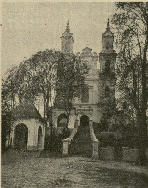
Kaścioł u Kalwaryi.

U najlepšym časie iduć bielarusy abychodźić Kalwaryju — wiasnoj, pa siaŭbie, kali ciopła i pryroda ũžo razwiłasia ũ krasie swajej. Staraja i hłybaka zakareniena ũ bielaruskim narodzie tradycyja, kab u Wilniu chadzić na Kalwaryju. Heta bielaruskaja prywyčka apošnim časam uzyjšła na swaju nowuju adradženSKUJU darohu. Bielarusy swaju Kalwaryju ũ Wilni abchodziać pabielarusku. Tam pabielarusku jany swaje pieśni pajuć i bielaruskija ksiandzy da ich tam pabielarusku pramaŭlajuć. Jak adna wialikaja bielaruskaja siamja, — jany na hetu Kalwaryju žbirajucca, ad stacy da stacy pabožna chodziać i ũdumanyja razwažajuć tajnicy ludzkoha zbaŭleńnia. Što za pryhožaja i jak pryjemnaja heta Kalwaryja ũ Wilni! Chto adbywaŭ jaje tam, toj heta