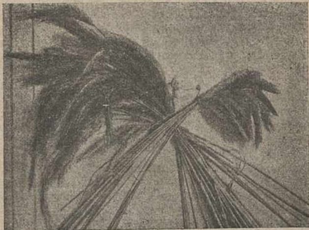
Каласкі атрыманыя пры абсыпаньню шыйкі збожжа, направа—без абсыпаньня

Кожная расьлінка складаецца з трох галоўных частак: 1) карэньняў, 2) шыйкі, злучаючай карнявую сыстэму расьлінкі з надземнай яе часткай і 3) надземнай часткі. Амаль у самай павярхні зямлі шыйка разьвівае так зван. вузел