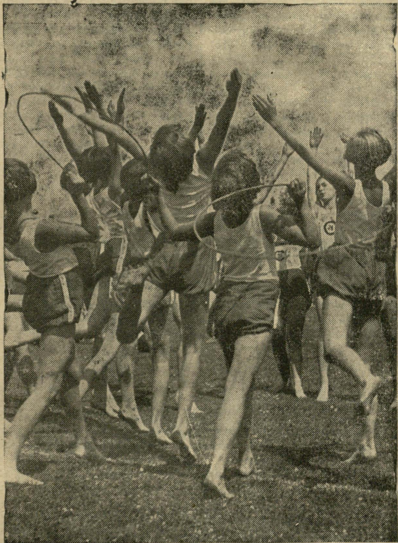
Гімнастычныя вьічэньнэ на пляжу.

Стражы, дык можна вельмі добра яе нагэта выкарыстаць. — Вялікай так-жа перашкодай у пашыраньні спорту зьяўляецца перакананьне нашых сялян, што: