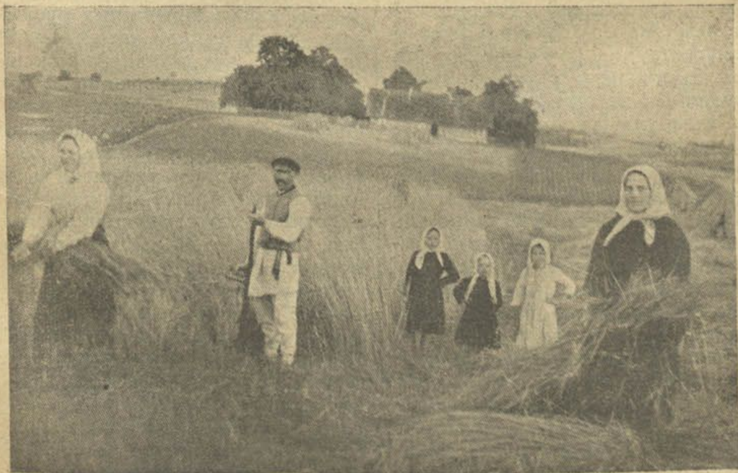
Памажы Божа ў цяжкай працы!..