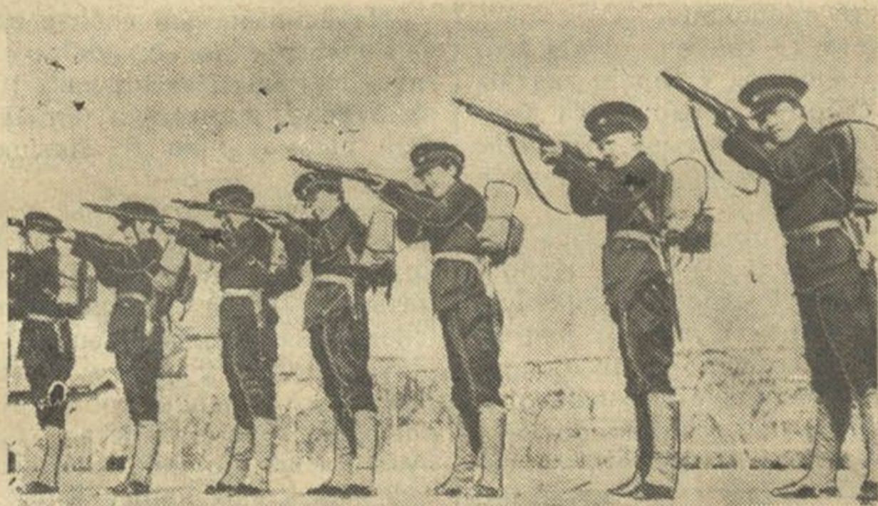
Kitajskija studentki z Universytetu ŭ Sanhaju, prachodziać vajsковыja ćvičeñni i vučacca stralać, kab mahčy ŭsiebakova baranić svaju bačkaŭščynnu ad varožaha čužynca.

Na Dalokim Ŭschodzie, zusim mahčyma, što vajna patryvaje doŭha. Japonii buduć pamahać Niemcy, Italiya, a Kitaju kamunisty. Tam moža być štoś padobna ha jak u Hišpanii, tolki z toj różnicaj, što kali ŭ Hišpanii majuć bolš šansaŭ na pieramohu pačynalniki chatniaj vajny — paŭstancy, to na Dalokim Ŭschodzie — Kitajcy, ŭna