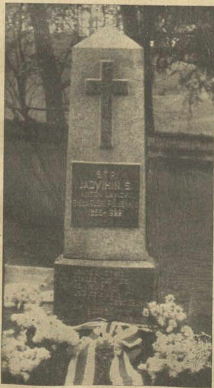
Памятник Ядвігіна Ш.

сельніцы, на Лукіскім пляцы ў Вільні, слаўны Кастусь Каліноўскі, як крываваая ахвяра, зложаная на аўтар расейскага царызму і імперыялізму, за волю і долю нашага краю, за волю і долю беларускага народу. Пачалася тады бязьлітасная і безаглядная рэакцыя. Запанавала атмасфэра цемры, няволі і прасьледу ўсякай вольнай думкі. І ў гэтай атмасфэры рос, вучыўся, разьвіваўся і працаваў Ядвігін Ш. Здавалася, што і ён мусіў праняцца гэтым нявольніцкім духам, стацца нявольнікам. Але не. Сіла цемры і нявольніцтва не перамагла сілы Духа Волі. Ідэалы Волі, за якія аддаў сваё жыцьцё Кастусь Каліноўскі, шырока і глыбока пайшлі ў народ. Гэтыя ідэалы ўзбагацілі душу Ядвігіна Ш. і далі яму магчымасьць стаць у рады