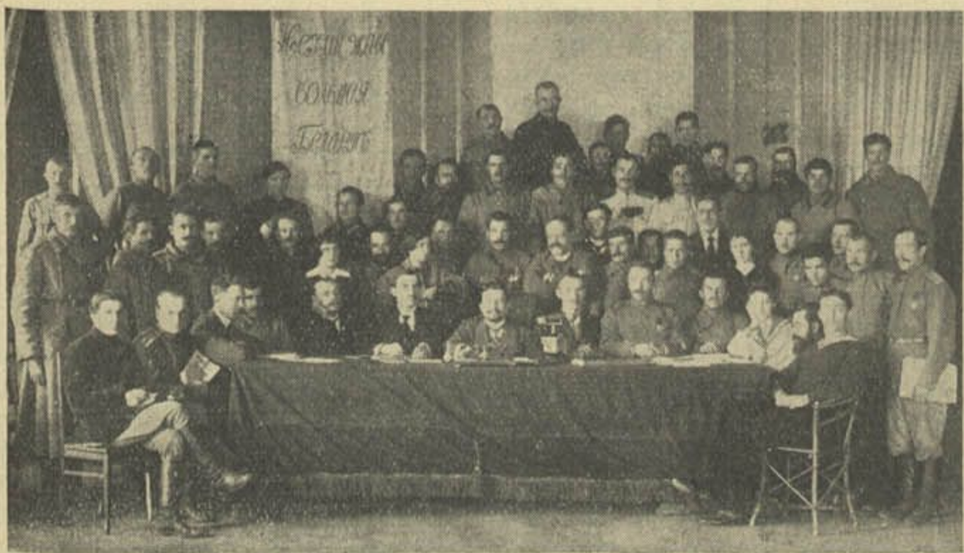
Вялікая Беларуская Рада, якая склікала ў 1917 г. у Менску Усебеларускі Кангрэс, каторы апісвае ў „Шляху Моладзі“ ведамы беларускі пісьменьнік і ўчаснік Кангрэсу Краўцоў Макара.

Вельмі цікавую прамову ў Сейме сказала 10.II пасолка В. Пэлчынская, каторая між іншым гэтак гаварыла: Польшч прызначана на тое, каб быць арганізатаркай вялікай працы на ўсходзе Эўропы, каб быць апорай заходняй хрысьціянскай культуры, апёртай на вольным чалавеку і на вольных і незалежных дзяржаўных арганізмах. Гэткая польская місія выцякае з ідэі ягайлаўскай і з духа Маршалка Я. Пілсудзкага. Гэткая палітыка мае вялікія магчымасьці спалучэньня украінскага, беларускага і літоўскага насельніцтва з Рэчыпаспалітай. Дзеля гэтага трэба адпаведнага пляну і трэба