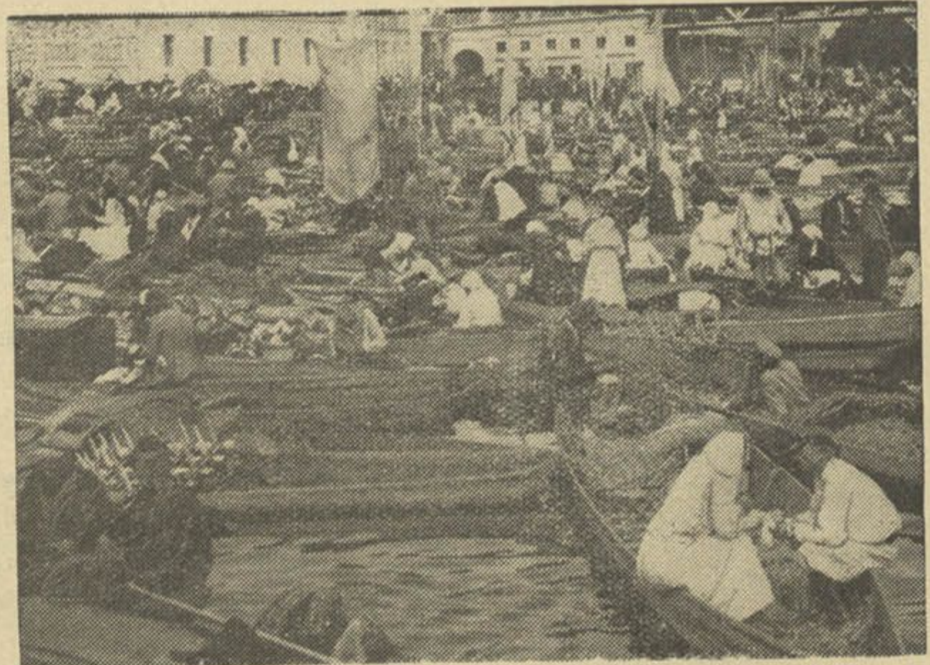
Знімка з м. Pinsk на Paleśsi, dzie ciapier adbyvajucca h. zv Paleskija Tarhi.

Зазначаем, што падобныя выпадкі сёлета, аб чым пісалі мы ў № 16 „Шл. Мол.“, часта здароўца на Падлясьсі, дзе жыве многа праваслаўных украінцаў. На нашых землях гэта, здаецца, першы выпадак.