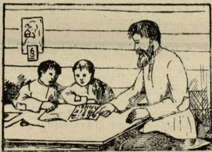
Čhto niavučacca pabielarusku ū škole pavinien rabić heta ū chacie!.

Pišam usio heta nia dziela taho, kab kaŭhoś razdražniać ci pad burać, a dziela taho, kab jašče raz źviarnuć uvahu školnych uladaŭ, što patreba bielaruskich školaŭ jość vialikaja. Bielaruskaja-ž mova ū pedahohičnych licejach, pedagogijach pavinna być uviedziena jak najchutčej. Pakul hetaha n'a budzie, analfabetyzm, ciemnata, pavarotnaja chvala analfabetyzmu buduć pavialičvacca. — Školnictva—aśvietnaje pracy ū našym kraji biez bielaruskaha jazyka, biez bielaruskich padručnikaŭ, knižak prosta nie mahčyma sabie pradstavić. Možna śmieła skazać, što bielaruskaje školnictva źjaŭlajecca najvialikšaj potreбай našaha kraju. Čvierdžannie heta nia tolki padtrymlivajuć imknieńni bielaruskaha narodu da bielaruskaje školy, ale taksama ūzhlady čysta pedahohičnyja, kulturnyja, ekaničnyja, a tak-ža budučynia polskabielaruskaha sužyćcia. J. N.