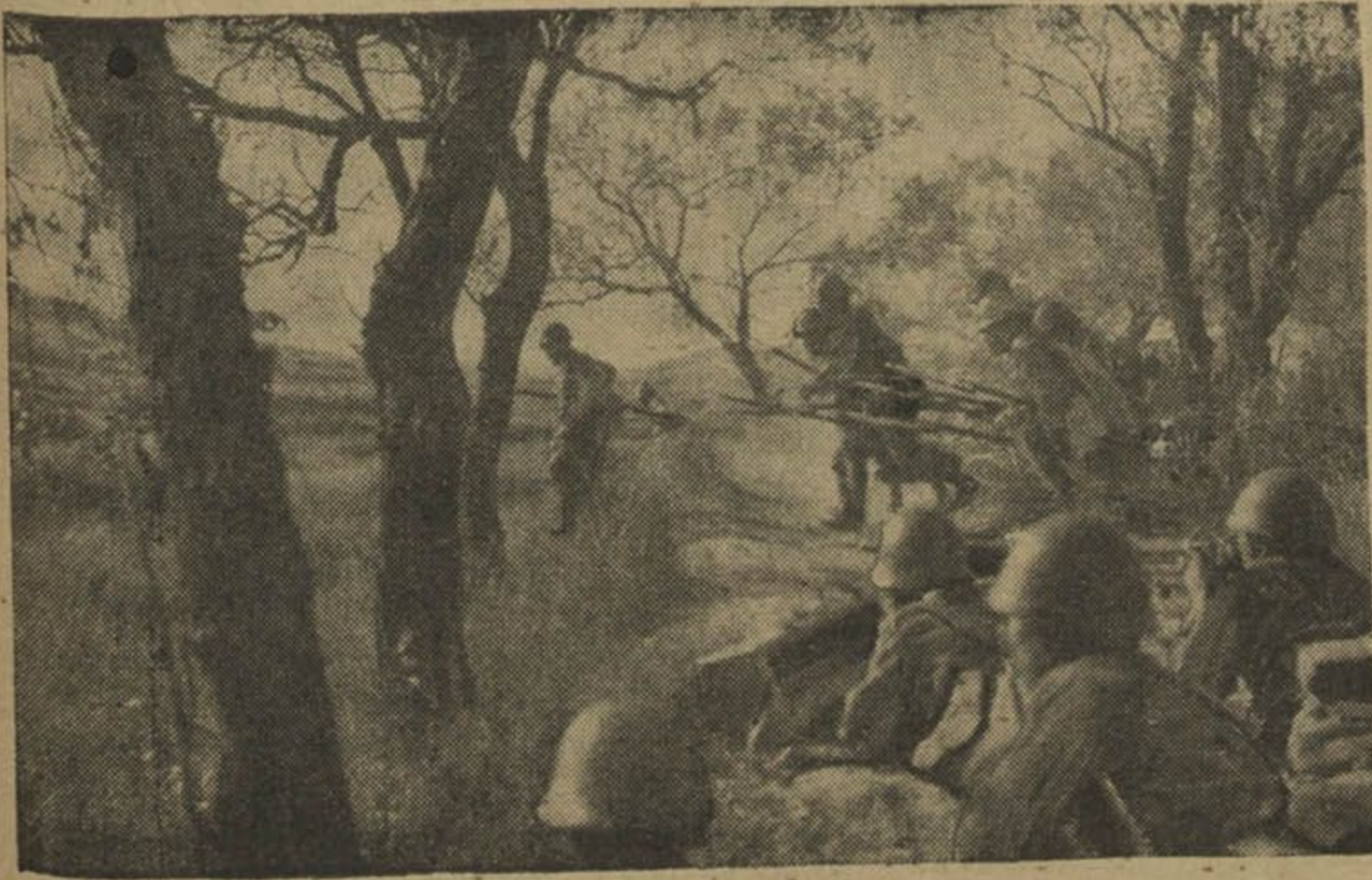
З японска-кітайскага фронту

Папажеііне рабоінікаў у СССР паһаршајецца. Паводле новапа закопу аб працы, у СССР за 20-сімінутнаје спа—жіеніе рабоініка моһуц зусім звоініч з працы. Пры тым рабоінік, јакі дысцы—плінарным спосабама будзіе звоініен з працы, һублаје ўсіе—правы і стаж, като—рых дабіўсіа раніејшај сваяеј працај, і нанова да працы можа быс прыіаіу тоікі пасла 3-ч міесіацаў.