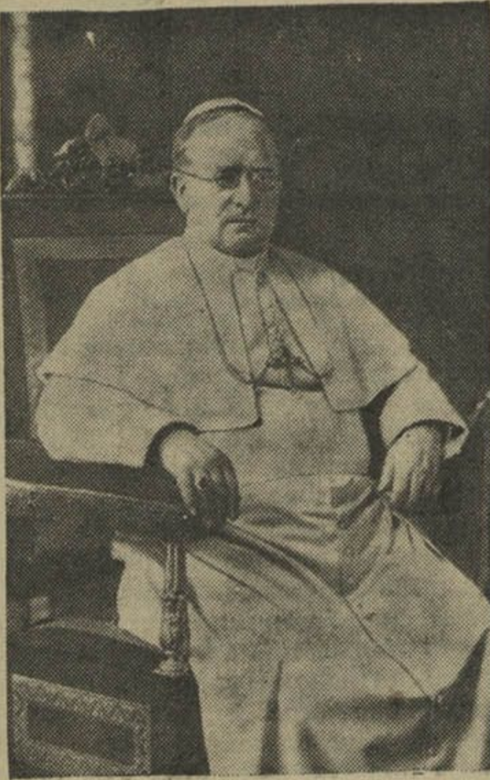
ПАПА PIUS XI

nijakaje relihii. Papa Pius XI luboŭ-ju ahartaŭ usie narody, adkidaŭ usiakuju nienaviść i baraniŭ vol-naść čaťavieka i narodu, jak naj-vyšejšaha hramadzkaaha ideału. Dziela taho rašuča vystupaŭ jon i prociŭ kamunizmu i prociŭ fašyzmu, i prociŭ inšych roznarodnych tota-lizmaŭ, katoryja ahrańičajuć lu-dziam svabodu, zavodzjačy dykta-