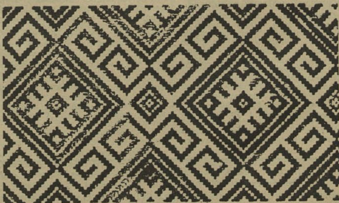
Грамдзіаніе! Kuplajcie paštoŭki z uzorami biełaruskich tkanin.

— 3.IV трагічна зьгінуў кароль арабскага гаспадарства Іраку — Газі. Забіўся ён наехаўшы на самаходзе на тэлеграфічны слуп.