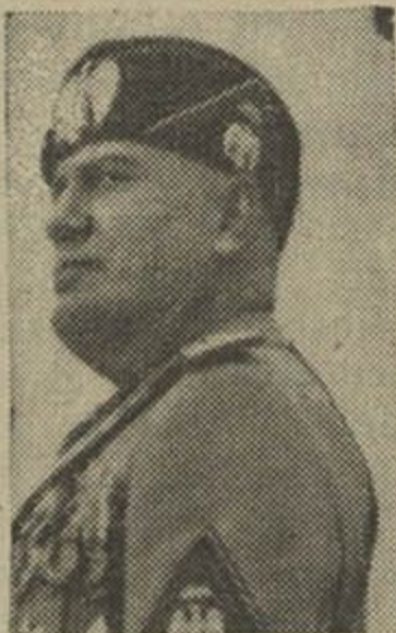
Dyktatar Italii B. Musolini

Italjancy naležać da hrupy narodaŭ romanskich i hetym zjaŭlajuca svajakami Francuzaŭ, da katorych adčuvajuć, nia hledziačy na apošnija rožnicy ŭ palitycy, vialikuju sympatyju.