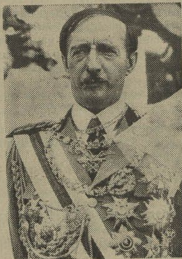
Karol Albanii Achmet Zogu

caŭ — mahametanie, 21 prac. — pravaslaŭnych i 11 prac. — katalikoŭ), ale ūžo što raz chutčej razbyvajucca čužych uplyvaŭ. Sušvietnaja vajna nie dała adnak Albanii ciešycca niezaležnym bytam, bo ū 1914 hodzie zajmajuć jaje čužyja vajsковыja siły, a ad 1917 h. Italija choča ūstanavić tam svaju ūladu, ad katoraje Albancy ūsiami silami baranilisia.