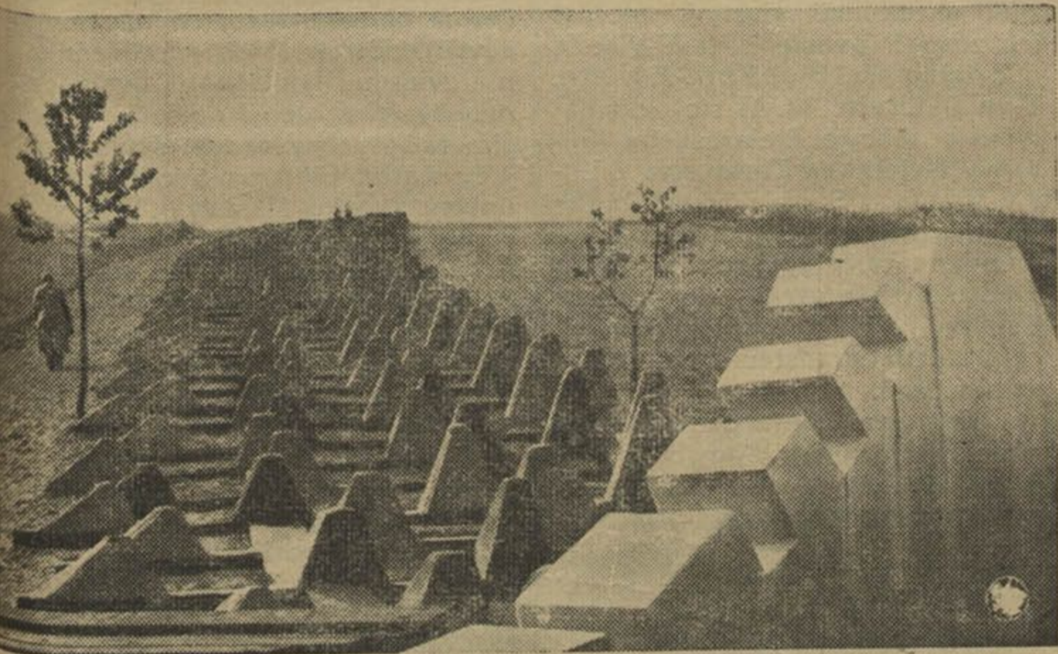
Проціўтанкавыя запоры лініі Зыгфрыда

пор. Усе крэпасьці гэтае лініі знаходзяцца ў зямлі. Навонкі бадай нічога ня відаць. Растуць дрэвы, збожа, стаяць хаты, а пры іх працуюць нармальна, як