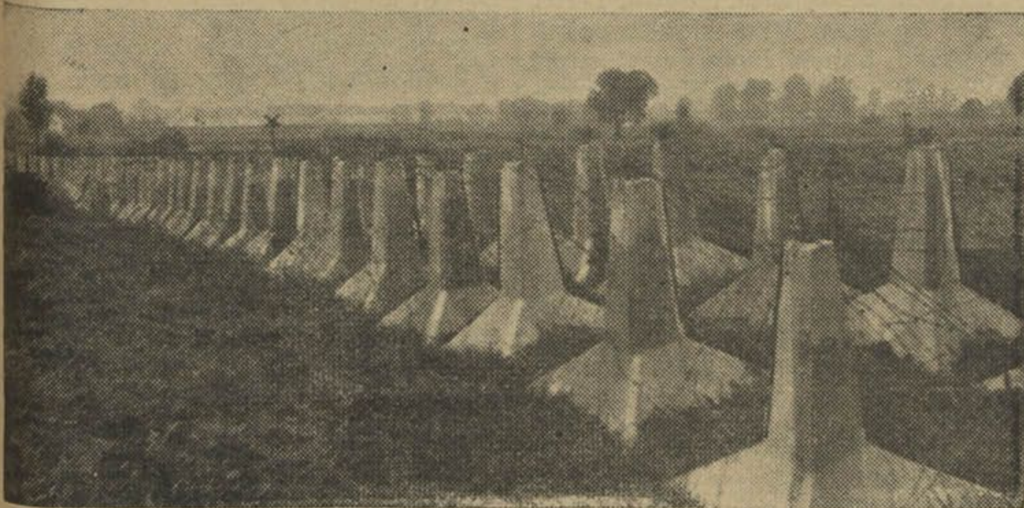
Проціўтанкавыя запоры лініі Мажіно

Паводле знатакоў, Лінія Мажіно вытрымае любы ваенны на-