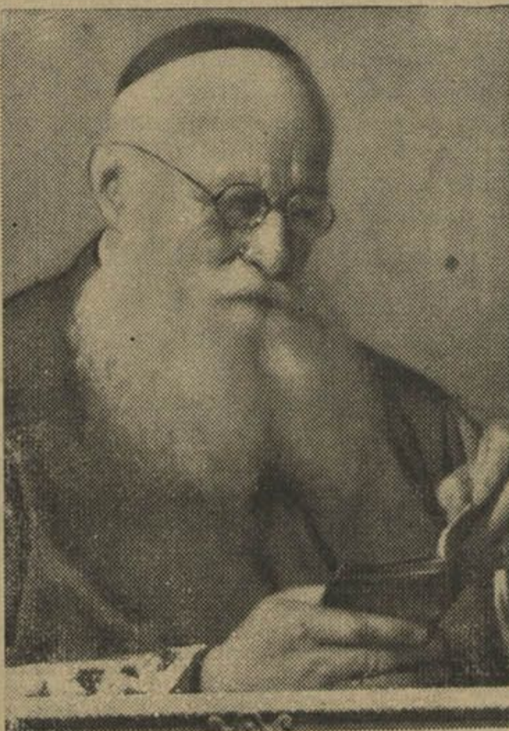
Śv. p. Arcybiskup E. Ropp

Papiež Benedykt XV u 1917 h. naznačyŭ jaho arcybiskupam mitrapalitam Mahiloŭskim. Pry jaho in-