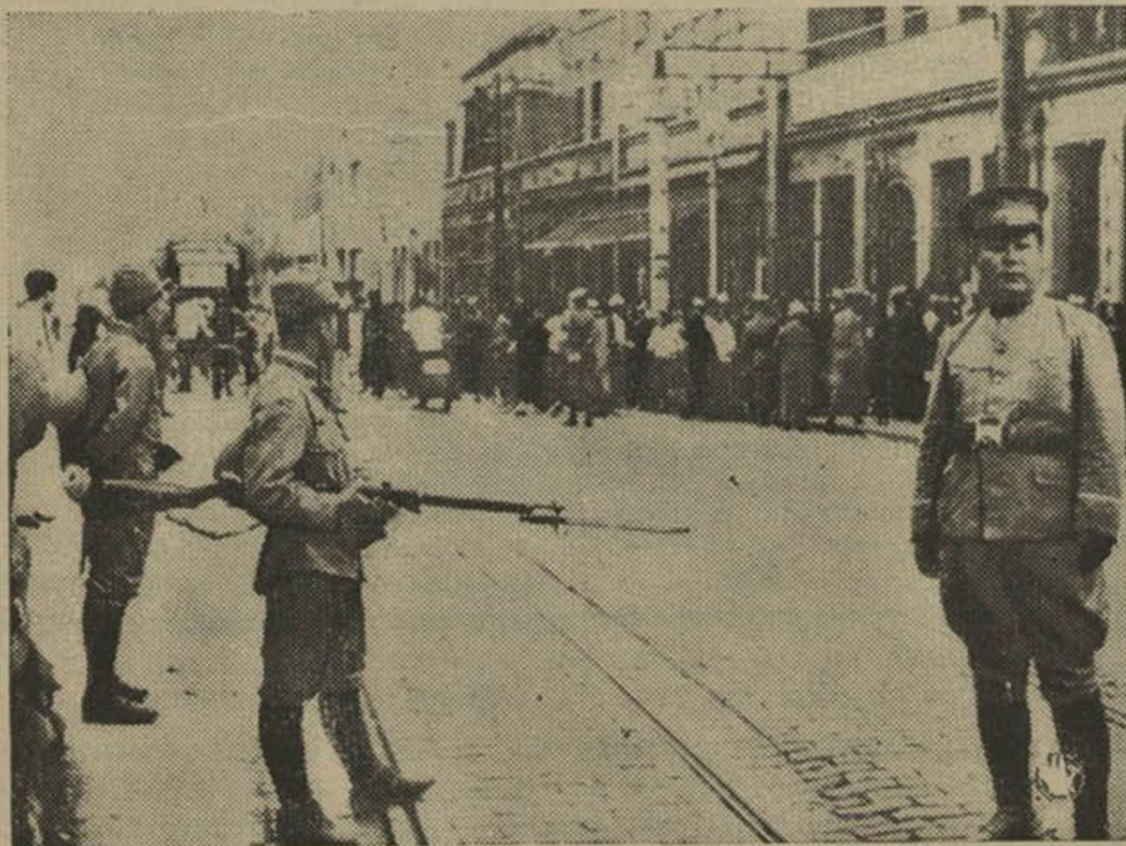
Японцы на граніцы ангельскай канцэсіі ў Тьентсіне