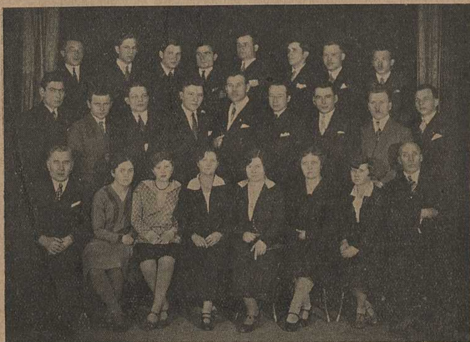
Група дэлегатаў на V Гадавы Юбілейны Зьезд Аб'яднаньня Беларускіх Студэнскіх Арганізацыяў („АБСА“) у Празе Чэскай дня 4 студзеня 1930 г.