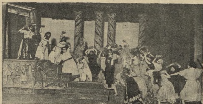
3-ці акт п'есы „Жрэц Тарквіні“ у пастаноўцы Менскага Беларускага Дзяржаўнага тэатру, пад рэжысурай Міровіча.