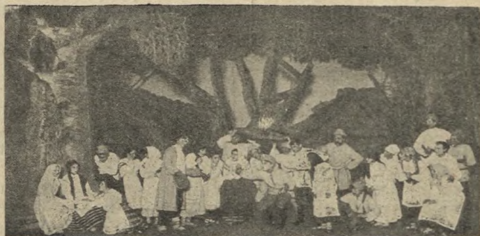
3-ці акт п'есы „На Купальле“, напісанай таланавітым беларускім паэтай і пачынаючым драматургам Міхасём Чаротам. Пастаноўка Менскага Беларускага Дзяржаўнага Тэатру, пад рэжысурай Міровіча.