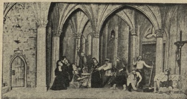
V акт п'есы С. Дылы «Панскі Гайдук», у п'ястаноўцы Менскага Беларускага Дзяржаўнага Тэатру, пад рэжысурай Е. Міровіча.

тышоў, якія не пажадаюць вывучаць беларускую мову і павінны будаць у іх з нашых школ, беларускія Настаўніцкія Курсы ў Рызе павінны падрыхтаваць кадры новых маладых вучыццалёў-беларусаў, добра ведаючых латыскую мову. Гэтыя маладыя настаўнікі і