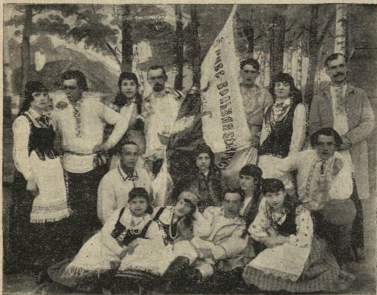
Група сяброў-закладчыкаў Т-ва «Беларускае Драмы і Камэдыі» улетку 1917 г.