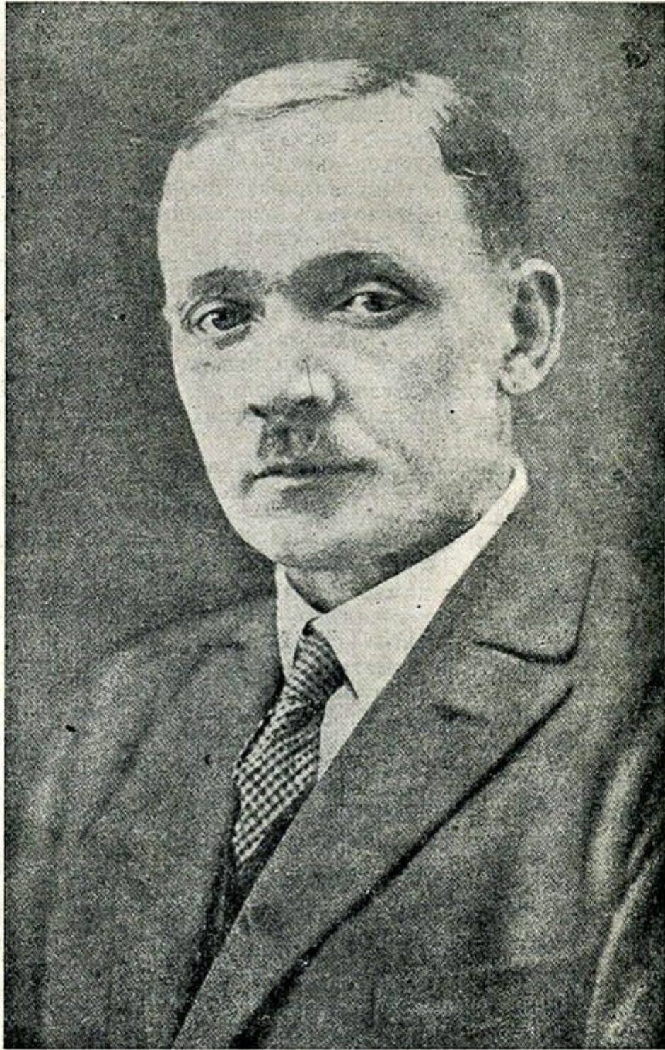
Янка Купала 1882—1932

папулярна - навуковы, пэдагогічны і літаратурна - грамадзкі штомесячнік.