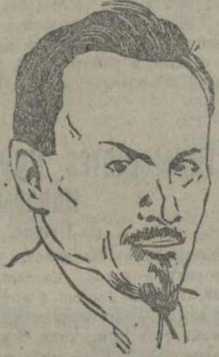
Тов. Н. И. БУХАРИН.

Если до сих пор наши враги не надеялись на большое число пакостей — этому помешало то обстоятельство, что у них у самих хлопот полон рот. Вы думаете, для Англии Китай — мягкий орех, и марокканская война для Франции представляет из себя пустяк? Такие вещи делают невозможным общее выступление против нас. Будем готовы дать отпор. Мы находимся на угрожаемом положении, которое требует у нас, чтобы