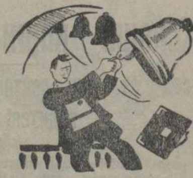
«Не посмотревши в сватцы—звонит в колокола».