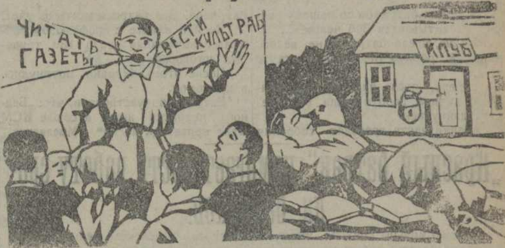
На собраниях—одно, на деле—другое.