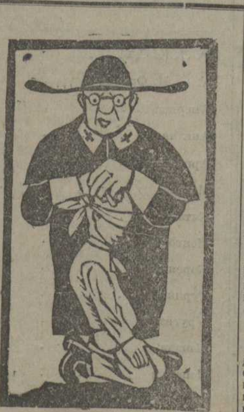
Как ксендзы проповедают молодежь.

Цели и задачи всех этих организаций лучше всего можно себе представить на основании их собственных поззаваний. Одно из них гласит: «Воспитание католических граждан через свободную самостоятельность при полном воздержании от алкоголя и никотина, путем путешествий, изучения народных песен и истинного народного искусства при угодной богу совместной работе с призванными для этого руководителями; подготовка к простой радостной, нравственной и глубоко-набожной жизни, воспитание из молодежи верных католиков. Этой деятельностью хотят предохранить рабочую молодежь от участия в классовой борьбе. Христианские профсоюзы очень редко принимают участие в борьбе и забастовках рабочего класса.»