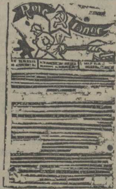
Стенная газета английских комсомольцев.

Читатели ждут газету с величайшим нетерпением. Получая официальную комсомольскую газету, подписчики