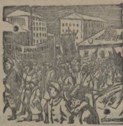
Демонстрация рабочих 1905 г.

Они конфисковали деньги старого правительства. Да, это были, несомненно, заодыи нового, народного или, если хотите, революционного правительства