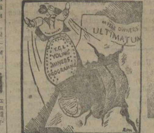
Карикатура, помещенная в стенной газете Англии.

Персия была разделена на две зоны влияния — русскую и английскую. Царские казачьи отряды и английские революционеры, а английские деньги шли на подготовку разрастание политическая дестабильность. С крушением персидского самодержавия в 1917 году англичане почувствовали себя и думали господствовать, доминируя в готовившейся Персии. Но победы русской рабоче-крестьянской революции над самодержавием и их несогласиями помощниками вхождению в персидскую революционную уверенность в том, что в Персии всегда будет справляться со своими врагами вне и внутри Персии. Повли шло на то, что ждали его в Персии угрожал постоянная опасность и поселенцы перебрались в Англию.